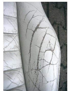
Ein Grenzfall bei weiterem Gebrauch, da das Leder durch Alterung schon stark geschwächt ist. Zu lange mit einer Reparatur gewartet. Falsche Pflegeprodukte oder Pflege.