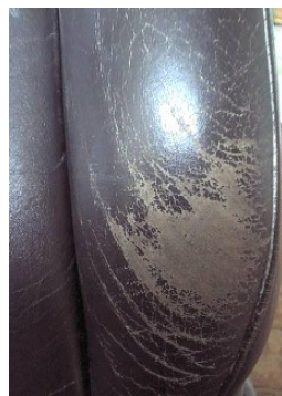
Typischer und leichter Fall und reparabel.