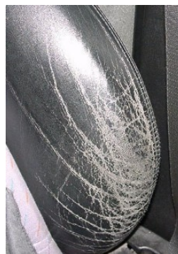
Typischer und leichter Fall und reparabel.