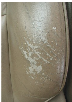
Typischer und leichter Fall und reparabel.